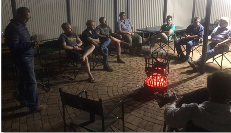
Die vergadering word soos gebruiklik voortgesit rondom die braaivleisvuur!